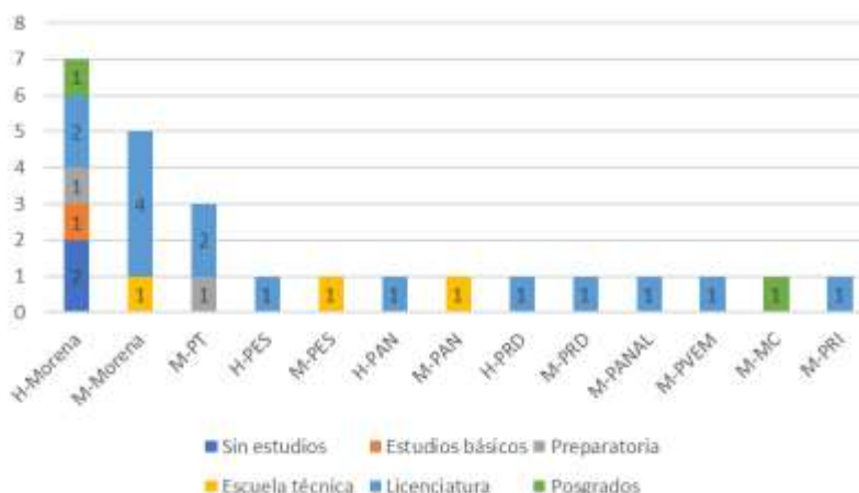
Gráfica 3. Estudios, por partido político Congreso del Estado de Tlaxcala, LXII Legislatura