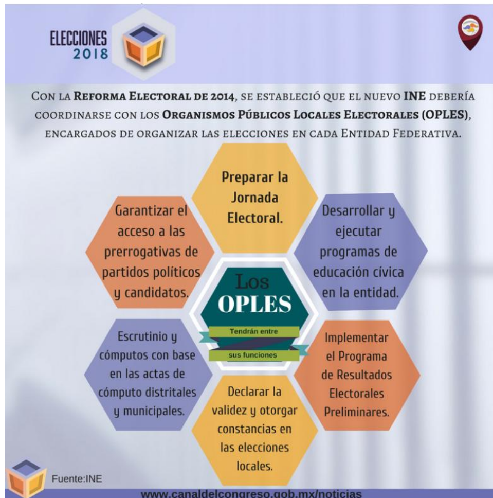
Imagen 4. Funciones de los OPLE a partir de la reforma electoral de 2014.