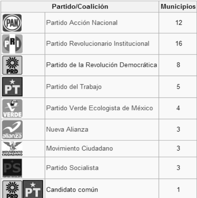
CUADRO 1 ESTADO DE TLAXCALA ELECCIONES JULIO 2013 MUNICIPIOS GANADOS POR PARTIDO POLÍTICO