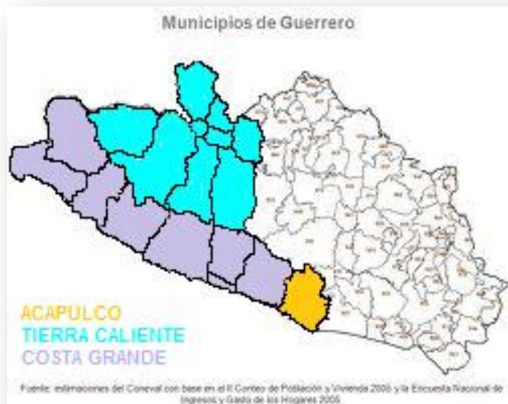
Mapa 2. (personificación del color)

Las regiones de mayor denuncia mediática, se reflejan el siguiente mapa: