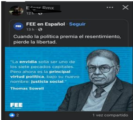
IMAGEN 8. Publicación de Facebook donde se hace una referencia a la envidia y resentimiento como orígenes de la justicia social.

Captura de una cita en la cual se relaciona la justicia social con la envidia y resentimiento- que tendrían las clases populares hacia la élite- adicionando la función de la política como reivindicador de la justicia social, pero -en la opinión de quien lo comparte- a cambio de la pérdida de la libertad.