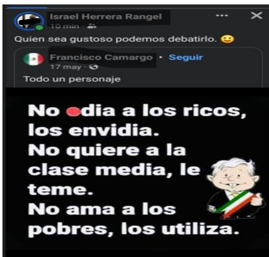
IMAGEN 5. Publicación de Facebook donde se presenta una imagen caricaturizada del expresidente Andrés Manuel López Obrador y una opinión respecto a consideraciones de clase.

Esta publicación es una frase enmarcada dentro de la temporada de celebración de las fiestas patrias y la discusión sobre la reforma al Poder Judicial. La estructura de la opinión de quien la comparte es que el apoyo que recibe MORENA -el partido en el gobierno- se debe al resentimiento, fanatismo, ignorancia y el uso clientelar de los programas sociales.