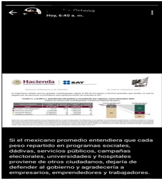
IMAGEN 7. Estado de WhatsApp donde se expresa una opinión sobre los programas sociales del gobierno de México como clientelismo .

Publicación donde se comparte una publicación pasada (recuerdo) donde se menciona que la base de la democracia es el populismo dejando entrever que es una amenaza a las libertades individuales la decisión de las mayorías. Quien lo vuelve a publicar reafirma con esta acción que está de acuerdo con ello.