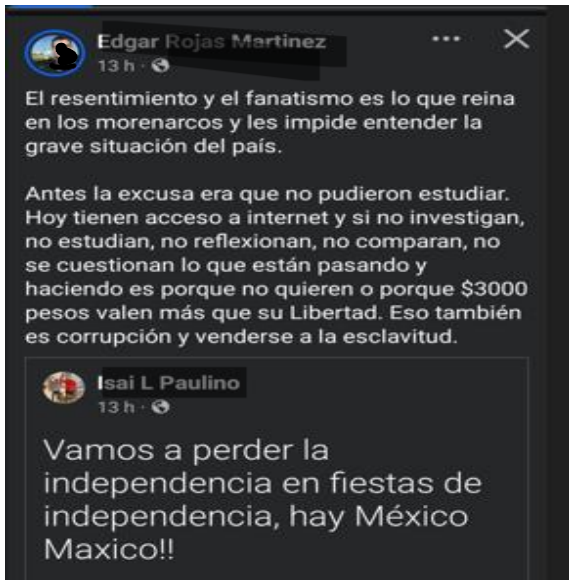
IMAGEN 4. Publicación de Facebook donde se presenta una opinión respecto a la consideración del motivo de apoyo hacia el expresidente Andrés Manuel López Obrador y el partido político MORENA.

Esta publicación es una frase enmarcada dentro de la temporada de celebración de las fiestas patrias y la discusión sobre la reforma al Poder Judicial. La estructura de la opinión de quien la comparte es que el apoyo que recibe MORENA -el partido en el gobierno- se debe al resentimiento, fanatismo, ignorancia y el uso clientelar de los programas sociales.