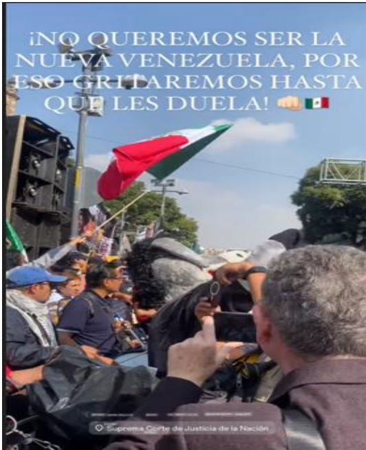
IMAGEN 10. Estado de Instagram donde se hace referencia a la reforma judicial haciendo una analogía con Venezuela.

Captura de un video de una manifestación de opositores a la reforma al Poder Judicial emitiendo una arenga en la cual justifican su oposición con la idea de que, de lograrse, se sentarían las bases para convertir a México en la “Nueva Venezuela”, con las consecuencias negativas que algunas personas asocian con el país sudamericano.