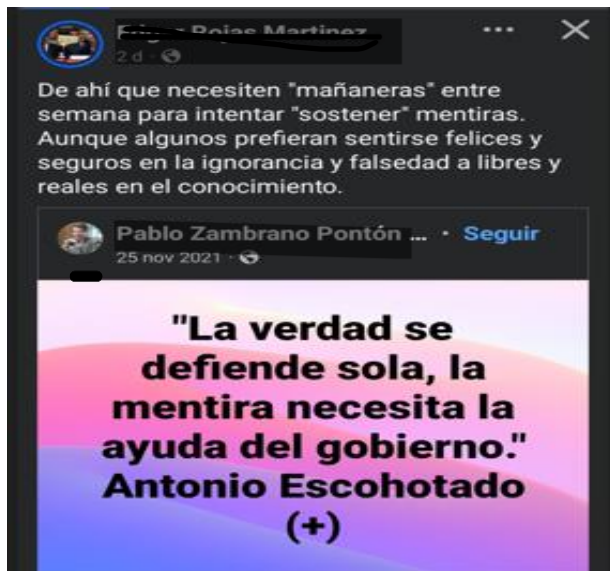
IMAGEN 2. Publicación de Facebook sobre la finalidad y objetivo de la conferencia de prensa presidencial llamada coloquialmente “la mañanera”.

En esta captura se presenta una frase en que se relaciona la idea de que los gobiernos tienden a defender la mentira y no la verdad, por lo cual quien comparte la publicación articula esa idea con su opinión sobre el ejercicio comunicacional del expresidente Andrés Manuel López Obrador de su conferencia matutina, rematando con la idea de quienes apoyan a la cuarta transformación son manipulables por este ejercicio.