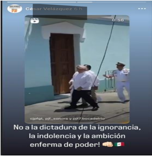
IMAGEN 3. Captura de un video corto de Facebook dónde resalta la imagen del expresidente Andrés Manuel López Obrador y un comentario referente a las bases de la “dictadura” que quien comparte la publicación considera que existe en México.

En esta captura se presenta una frase en que se relaciona la idea de que los gobiernos tienden a defender la mentira y no la verdad, por lo cual quien comparte la publicación articula esa idea con su opinión sobre el ejercicio comunicacional del expresidente Andrés Manuel López Obrador de su conferencia matutina, rematando con la idea de quienes apoyan a la cuarta transformación son manipulables por este ejercicio.