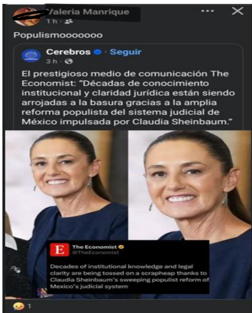
IMAGEN 9. Publicación de Facebook donde se hace referencia a la reforma del Poder Judicial y su relación con el populismo.

Captura de una cita en la cual se relaciona la justicia social con la envidia y resentimiento- que tendrían las clases populares hacia la élite- adicionando la función de la política como reivindicador de la justicia social, pero -en la opinión de quien lo comparte- a cambio de la pérdida de la libertad.