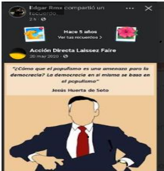
IMAGEN 6. Publicación de Facebook donde se comparte una opinión sobre la relación entre democracia y populismo.

Publicación donde se comparte una publicación pasada (recuerdo) donde se menciona que la base de la democracia es el populismo dejando entrever que es una amenaza a las libertades individuales la decisión de las mayorías. Quien lo vuelve a publicar reafirma con esta acción que está de acuerdo con ello.