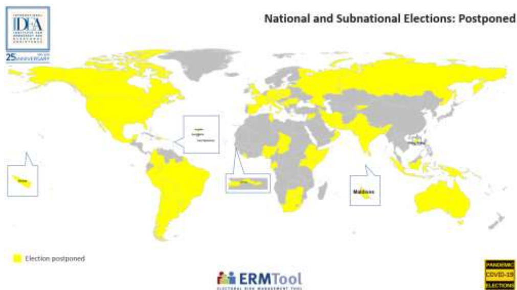
Mapa generado el 6 de agosto con la herramienta de gestión de riesgos electorales de IDEA Internacional ( ERMTool )

Un total de 69 elecciones fueron pospuestas en distintos países.