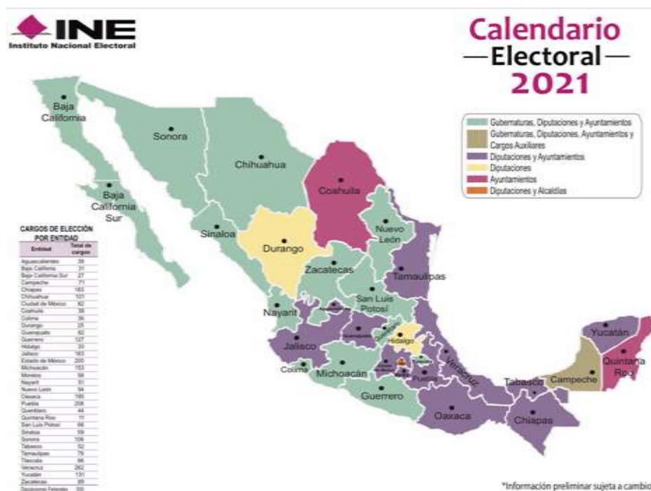
Mapa creado por el Instituto Nacional Electoral (INE)

Se prevé un incremento de cinco millones más que en el 2018 de ciudadanas y ciudadanos inscritos en el Padrón Electoral por lo que se estima una participación de 94,800,000 ciudadanos y ciudadanas, por lo que habría necesidad de instalar 161,000 casillas de