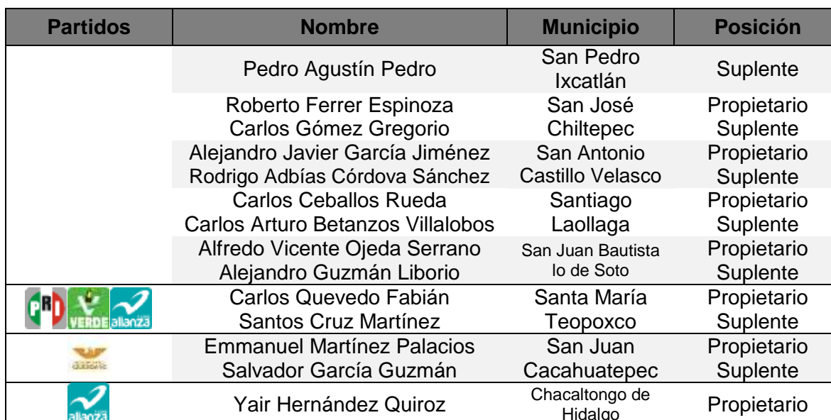
Cuadro 1. Extraído de la sentencia dictada en los expedientes SUP-JDC-304/2018 y acumulados, p. 33.

Atenta a dicha problemática, la Sala Superior atrajo el caso. La temática que se le planteó no fue sencilla, ya que debió compaginar los derechos “de identidad” (libertad para definir como quiero que me perciban los demás) e “igualdad” (derecho al voto pasivo), al responder a las siguientes preguntas ¿es válido que las personas transexuales puedan beneficiarse de la cuota de género?, si es así, ¿qué elementos deben exigirse para su registro?, y en el caso específico ¿fueron legítimas estas candidaturas o se trató de un fraude a la ley (nueva modalidad de juanitas)?