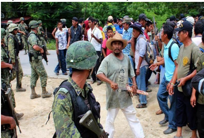
Confrontación y desalojo de policías comunitarios, indígenas y campesinos en el municipio de Cruz Grande, 27 de agosto de 2013.

La Costa Chica y montaña son el ejemplo del atraso al que se ha sometido a las comunidades indígenas y el reflejo de la permanencia de las estructuras más arcaicas de control político como el cacicazgo. La falta de empleo causada por los bajos niveles de educación y el abandono del campo principalmente, ha orillado a