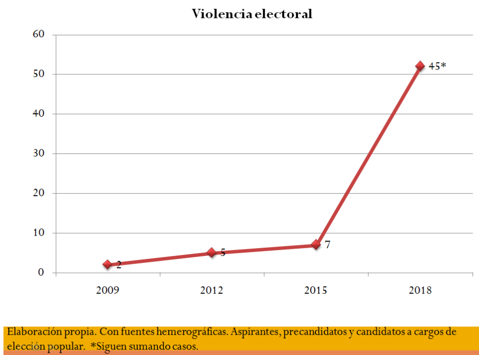
Figura 2. Asesinatos a aspirantes, precandidatos y candidatos a cargos de elección popular por periodo electoral.

Se han identificado a estas personas de acuerdo al periodo en que buscan obtener un cargo de elección popular. Hablamos de un aspirante cuando una persona opta por la vía independiente, un aspirante a precandidato para una persona que milita en un partido político, un precandidato es cuando formalmente está compitiendo en una elección interna y para un candidato sucede cuando su partido o coalición lo ostenta como tal. Y en el caso de los candidatos independientes, se da respecto al cargo, es decir; si es un cargo local lo