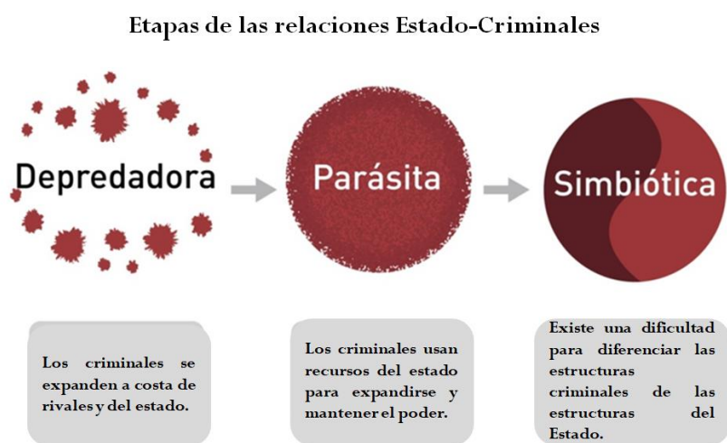
Figura 4. Etapas de las relaciones Estado-Criminales.

Dudley, S. (2016). Elites y crimen organizado: Marco conceptual- crimen organizado.