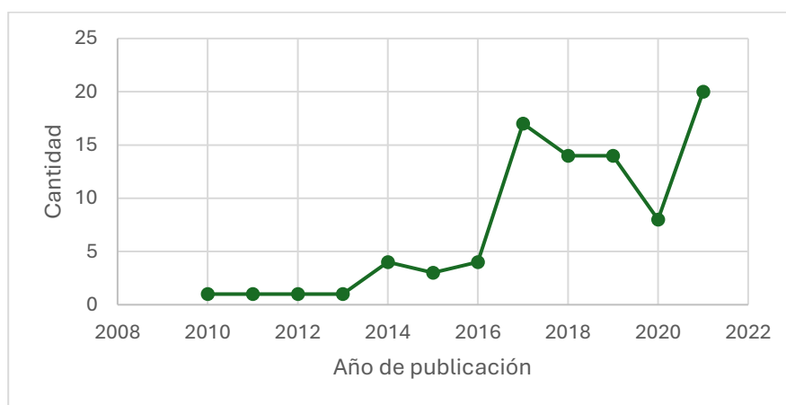
Gráfica 2. Estudios analizados por año de publicación (2010-2021)

Fuente: Elaboración propia a partir de las investigaciones comprendidas en la muestra (2010-2021)