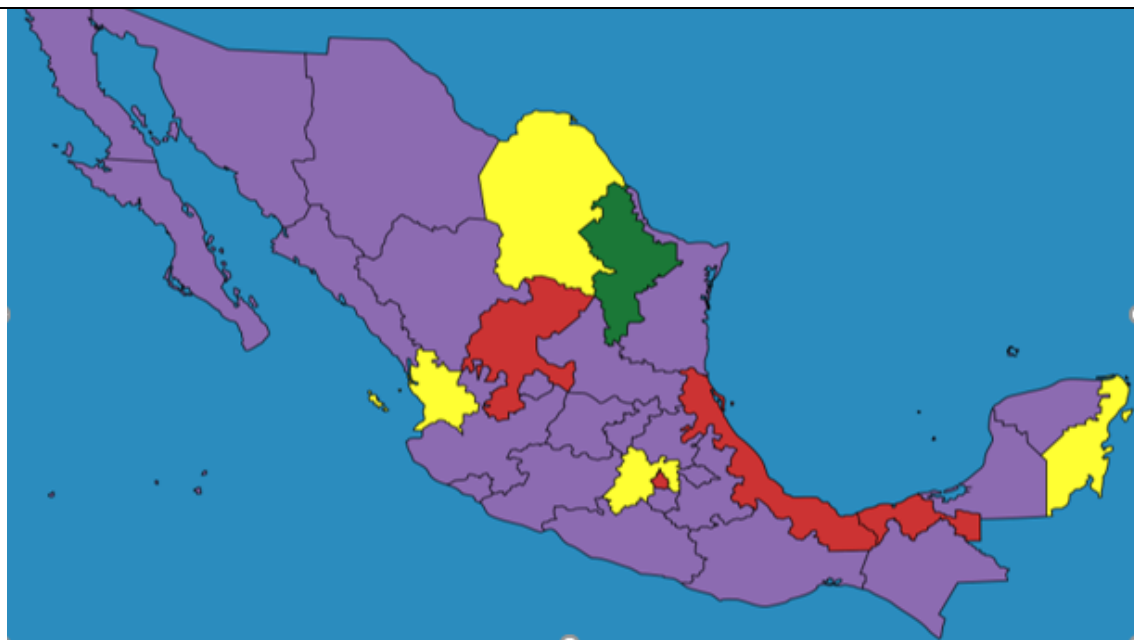
Mapa. Reformas en materia de paridad de género y violencia política en las entidades federativas