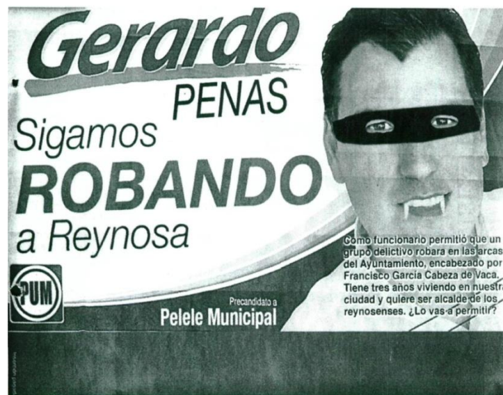
Figura número 2

En este asunto, el 18 de julio de 2007, el PAN presentó ante el Consejo Estatal Electoral de Tamaulipas, una denuncia en contra de la “Editora Hora Cero S.A. de C.V.” por la publicación de propaganda denostativa en su contra y de su entonces candidato a presidente municipal por Reynosa, Tamaulipas.