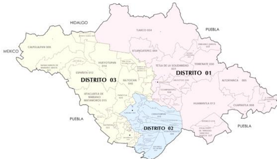
Figura 2. Distritos electorales federales de Tlaxcala