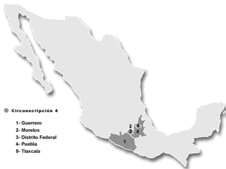
Figura 1. Circunscripción electoral 4