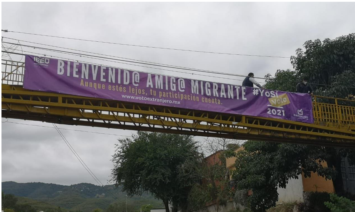
Imagen 5. Personal del IEEQ colocando mensajes para la caravana migrante. Jalpan, Dic-2020)

Si bien el Instituto tuvo prohibida la entrega de algunos materiales debido a lineamientos internos por la emergencia sanitaria, le fue posible entregar cilindros para agua con la imagen del instituto y con un código QR para acceder a la información sobre el concurso de fotografía y otro a la información sobre el proceso de credencialización, registro y voto desde el extranjero.