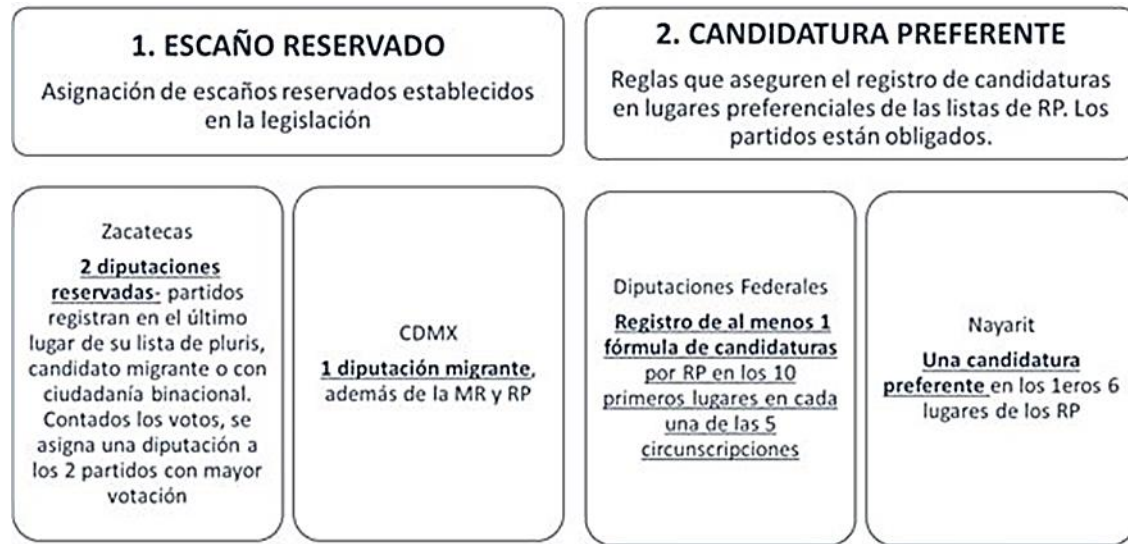
Figura 3. Mecanismos de representación de ciudadanía mexicana residente en el extranjero durante el proceso electoral 2020-2021