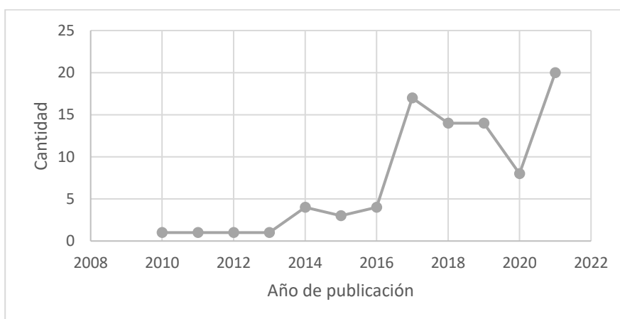
Gráfica 2. Estudios analizados por año de publicación (2010-2021)

Fuente: Elaboración propia a partir de las investigaciones comprendidas en la muestra (2010-2021)